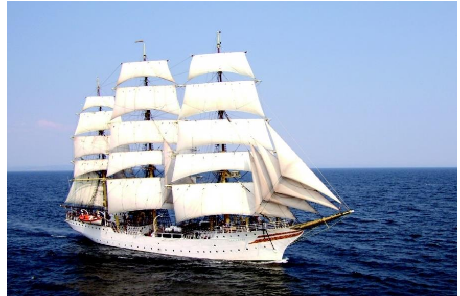
Stiftelsen Fullriggeren Sørlandet | The Ship Sørlandet

Hun har overlevd tysk fangenskap, sovjetiske bomber, konkursbo og forfall. I dag seiler fullriggeren Sørlandet rundt i bunnløs gjeld, men er fortsatt like uangripelig