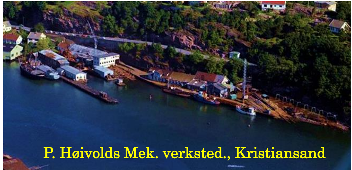
P. Høivolds Mek. verksted., Kristiansand

https://www.fvn.no/nyheter/lokalt/i/xdXAn/Gammelt-og-luftig-fra-Kristiansand