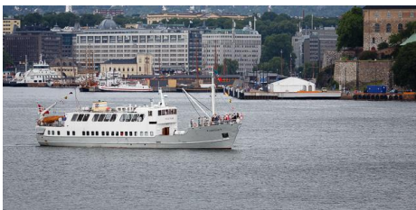
MS «Vestgar» ble levert i februar 1957 fra P. Høivolds Mek. Verksted .