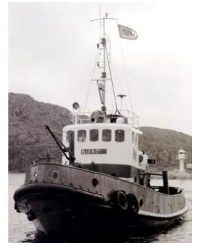
«Sørhavn» ble bygget ved P. Høivolds mek. verksted (nr. 19) i Kristiansand for Den norske stat ved Statens Havnevesen, senere Kystverket, Oslo. Fartøyet ble levert i 1958,